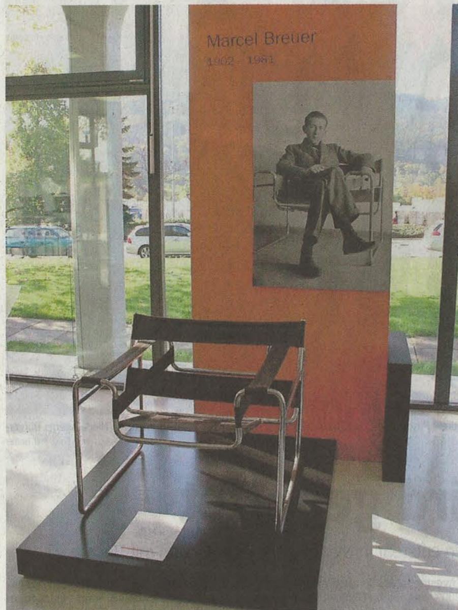
Eines der berühmtesten Bauhaus-Exponate ist im Freudenberger Rauch-Museum zu sehen: der Stahlrohr-Stuhl von Marcel Breuer.