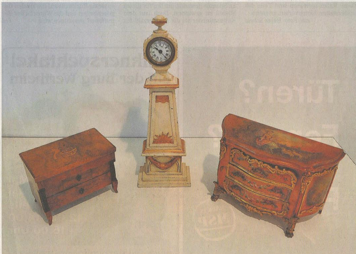
Diese Stücke aus der Rokoko- und Biedermeierzeit ergänzen die Sammlung des Freudenberger Rauchmuseums.